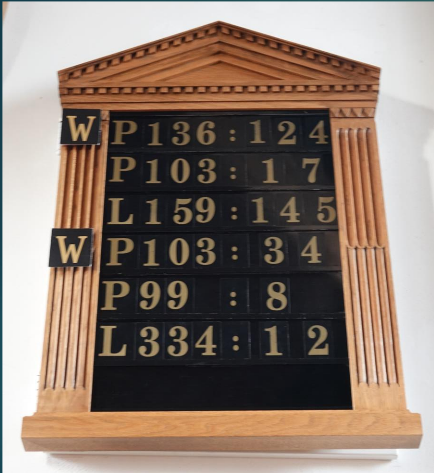
Psalmen- en liederenbord na de restauratie in 1993