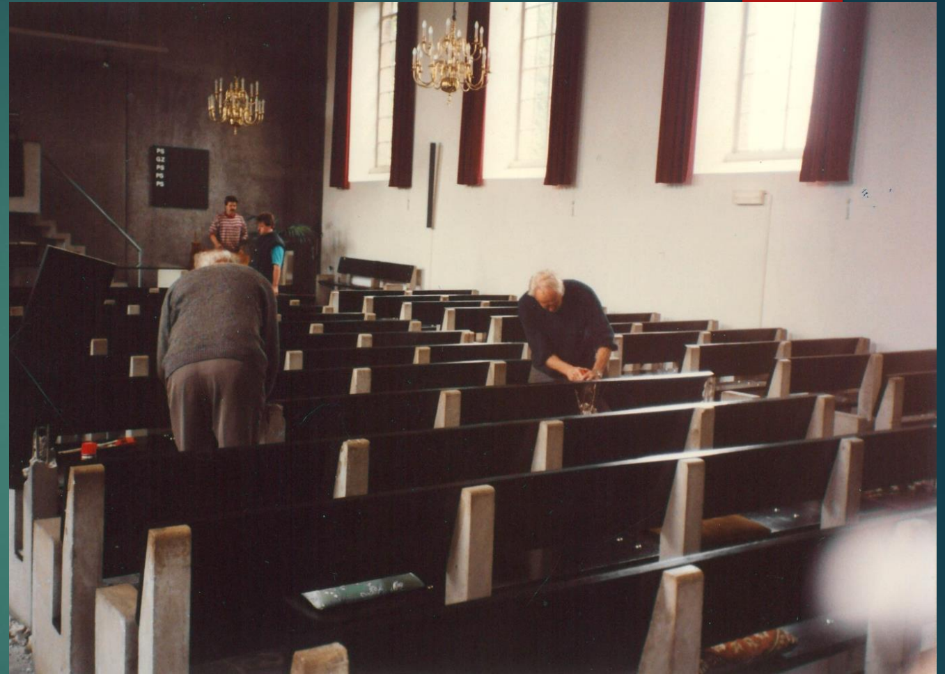
Na goedkeuring worden de oude banken in 1992 gedemonteerd