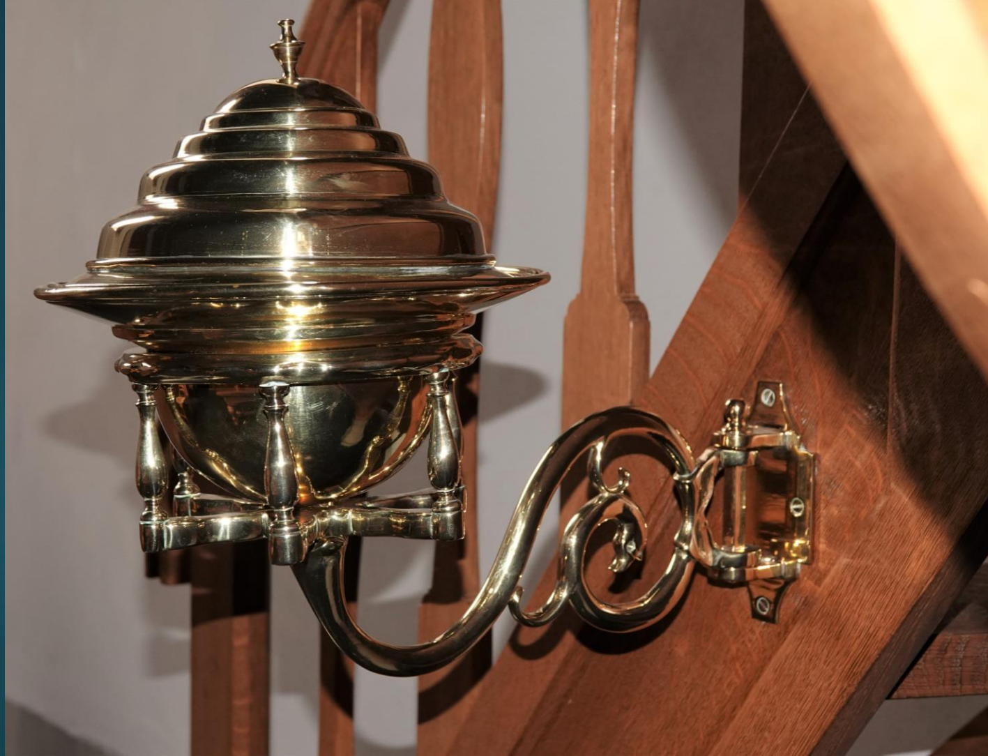
Doopbekken en -houder vermoedelijk uit 1823