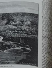
Waterfall in het Elbano.

De Heere is mijn rots en mijn vesting, mijn verlossing en mijn God.