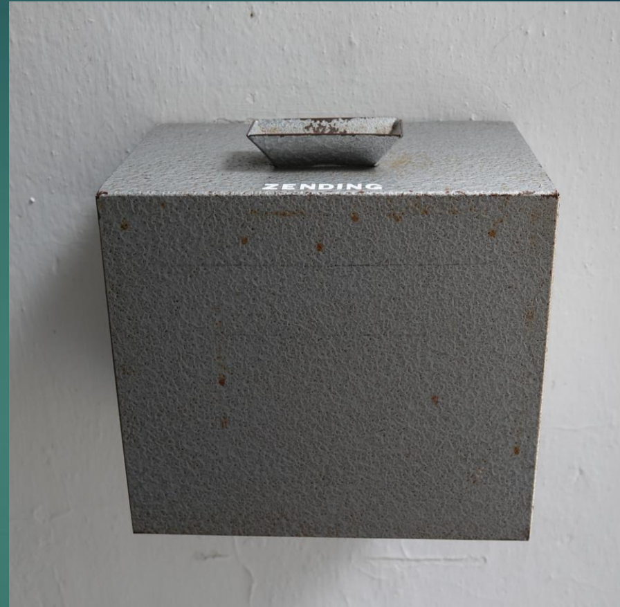
“Offerblok” en “busje” voor de zending