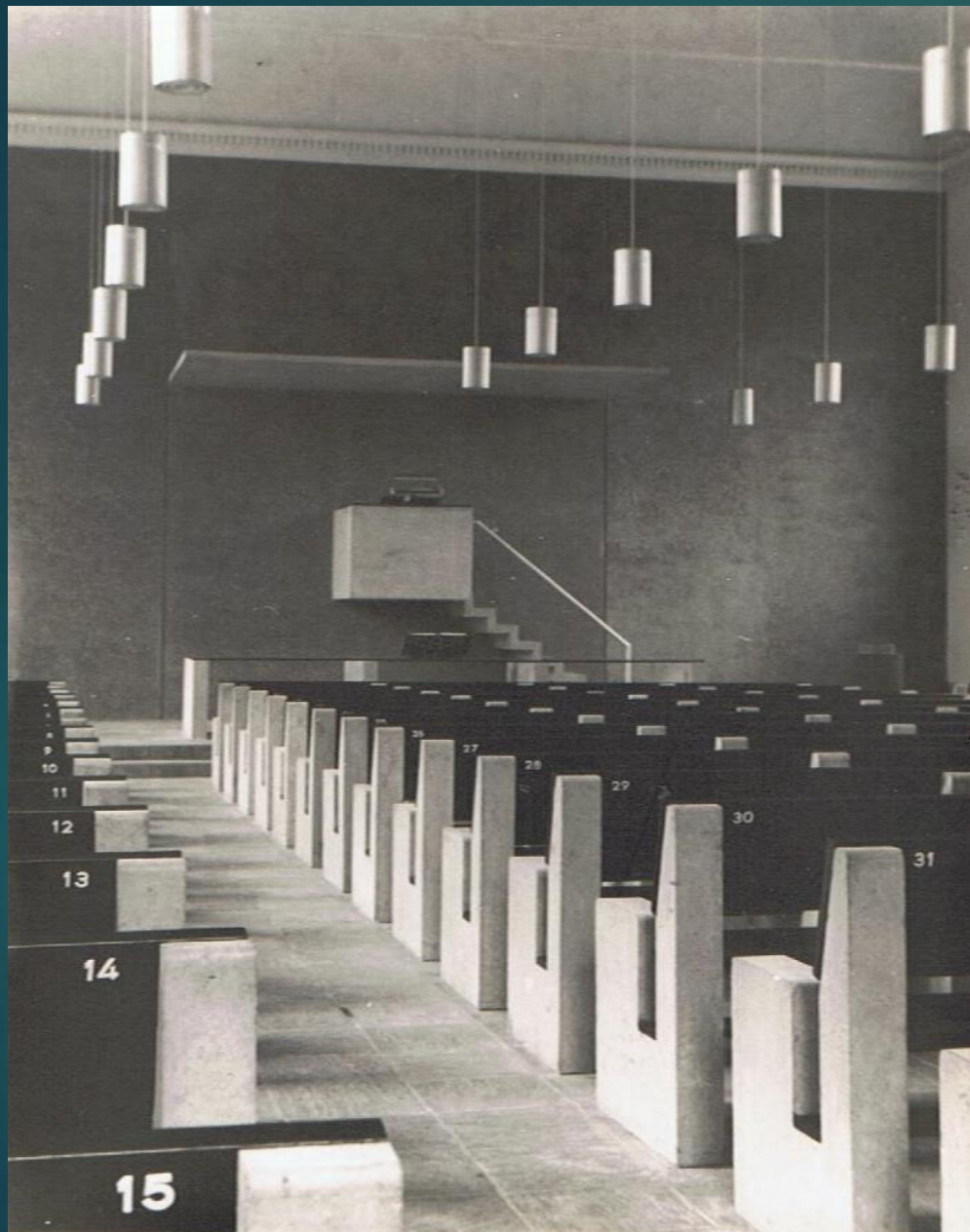
Kerkinterieur na de vernieuwing in 1957