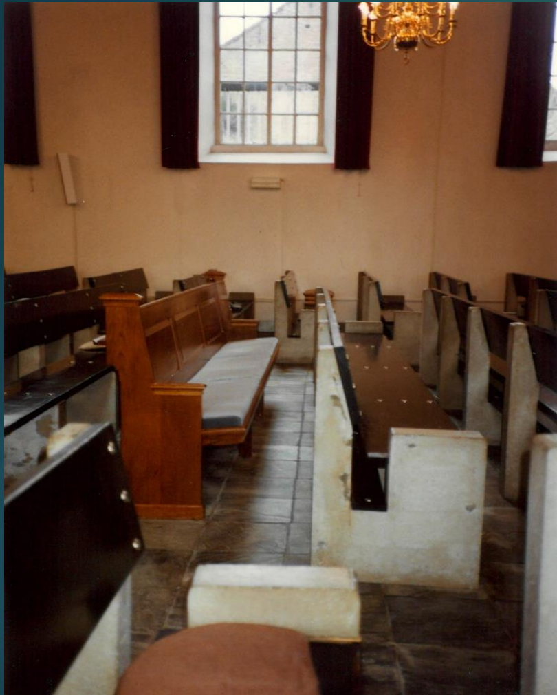
Er wordt een 'proefbank' in de kerk geplaatst om het zitcomfort te testen