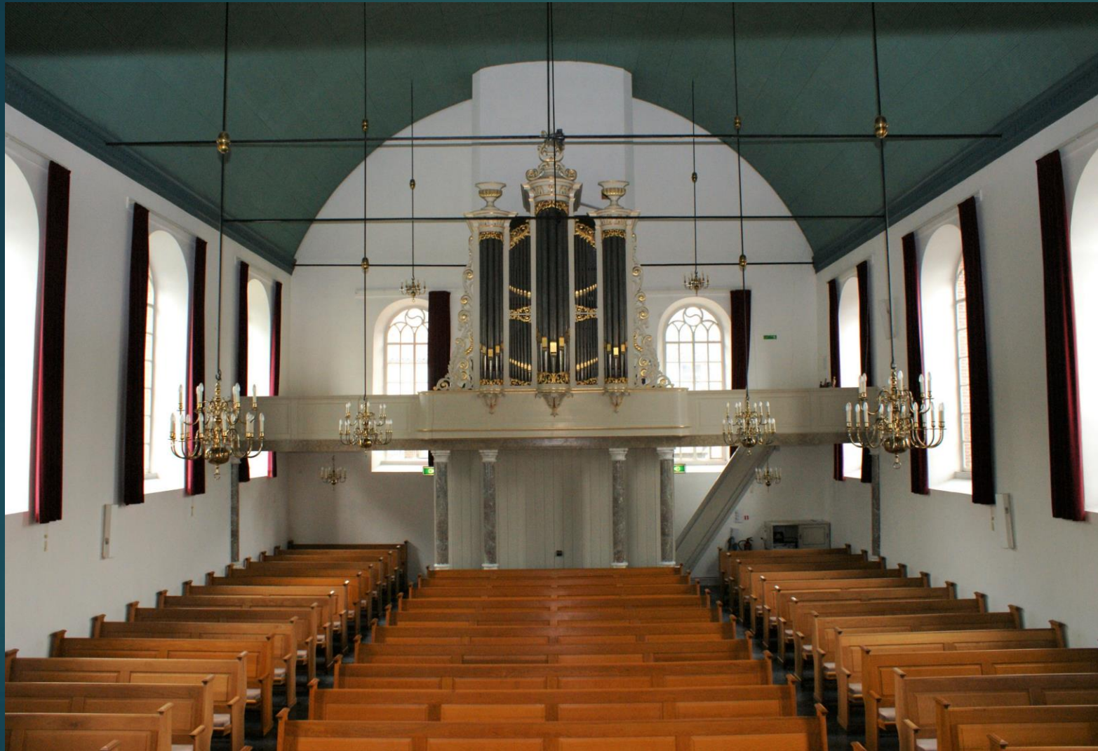
Kerkzaal en orgelfront sinds 1993