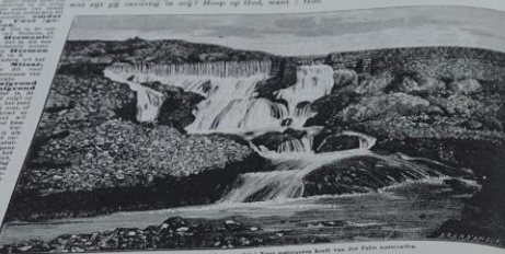
Waterfall in het Elbano.

De Heere is mijn rots en mijn vesting, mijn verlossing en mijn God.