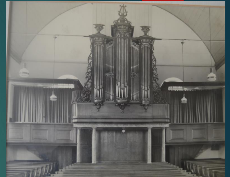
Kerkzaal en orgelfront vóór 1957