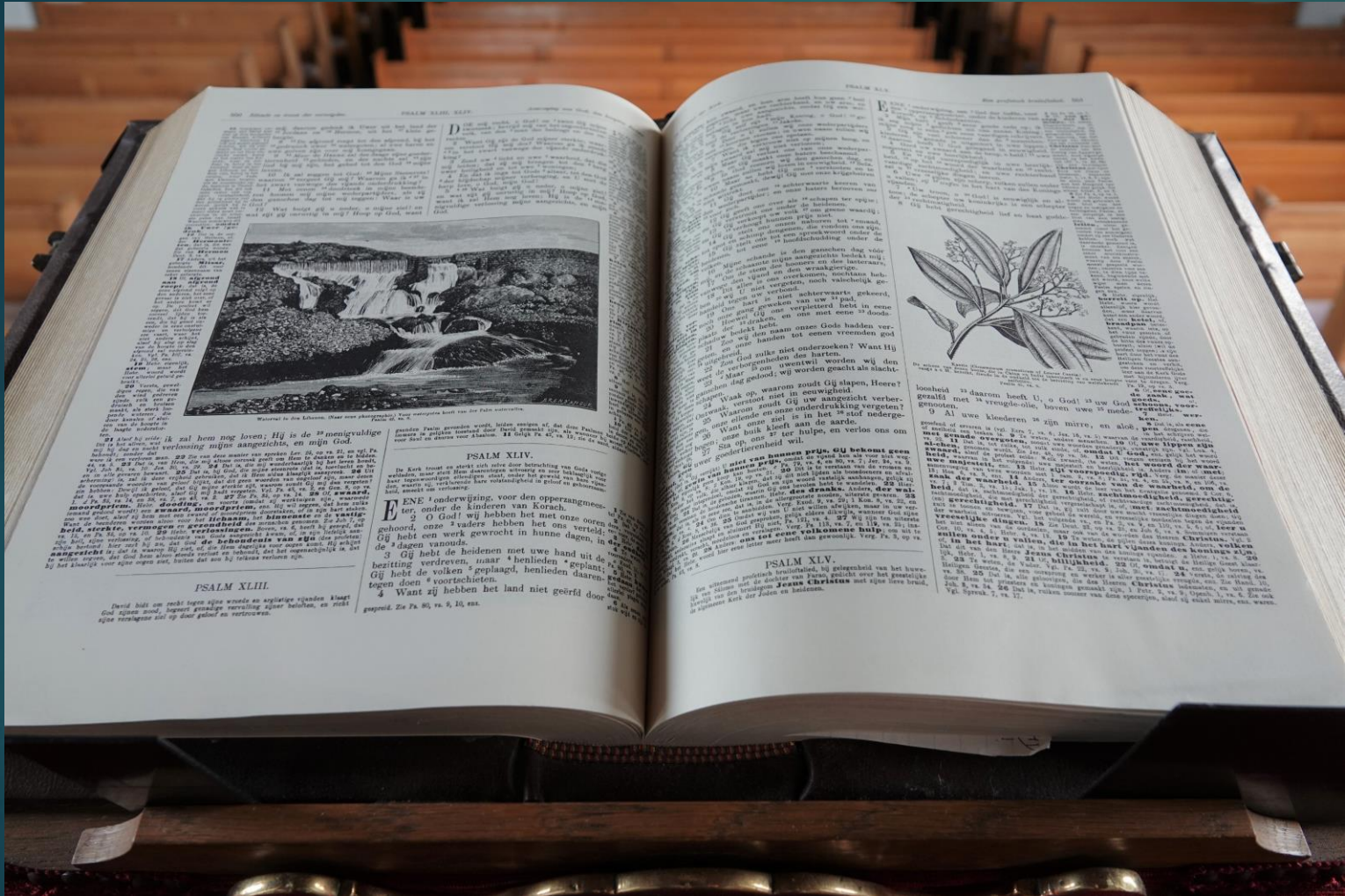
Kanselbijbel uit 1993